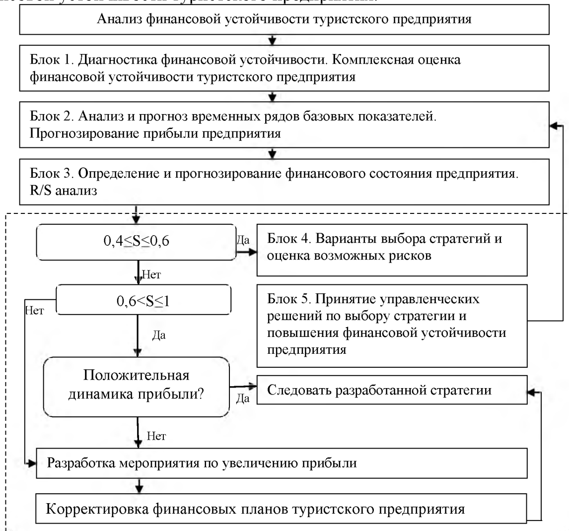
Рис. 4. Алгоритмическая структура оценки и прогнозирования финансовой устойчивости туристского предприятия

финансового состояния происходит выбор стратегий и оценка возможных рисков, а также принятие управленческих решений по выбору стратегии и повышения финансовой устойчивости туристского предприятия.