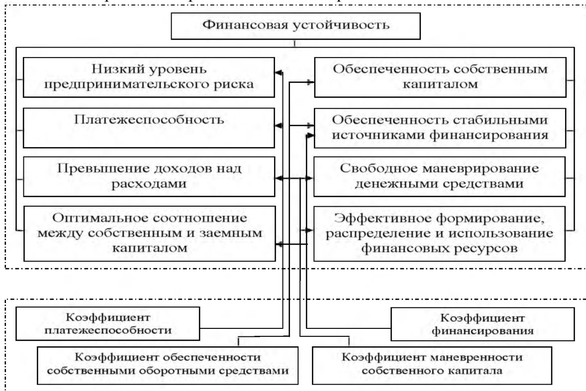
Рис. 1. Схема соответствия используемых коэффициентов оценки финансовой устойчивости ее признакам

маневрирование денежными средствами, эффективное формирование, распределение и использование финансовых ресурсов; оптимальное соотношение между собственным и заемным капиталом; низкий уровень предпринимательского риска. Учитывая то, что совокупность финансовых коэффициентов, позволяющих оценить уровень финансовой устойчивости, включает отдельные взаимоисключающие или функционально взаимосвязанные между собой показатели, предлагается в качестве индикаторов финансовой устойчивости использовать коэффициенты платежеспособности, финансирования, обеспеченности собственными оборотными средствами и маневренности собственного капитала.