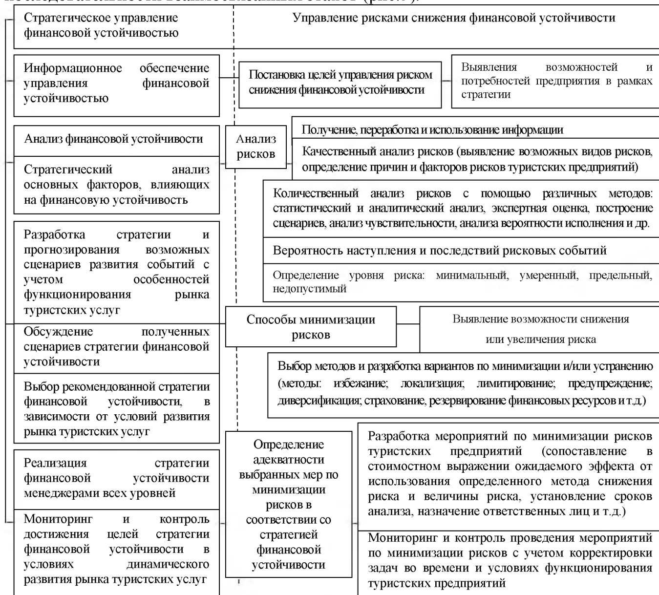
Рис. 5. Схема управления финансовой устойчивостью туристских предприятий и рисками её снижения

Важным инструментом управления финансовой устойчивостью туристского предприятия является управление риском ее снижения, которое реализуется в виде последовательности взаимосвязанных этапов (рис.5).