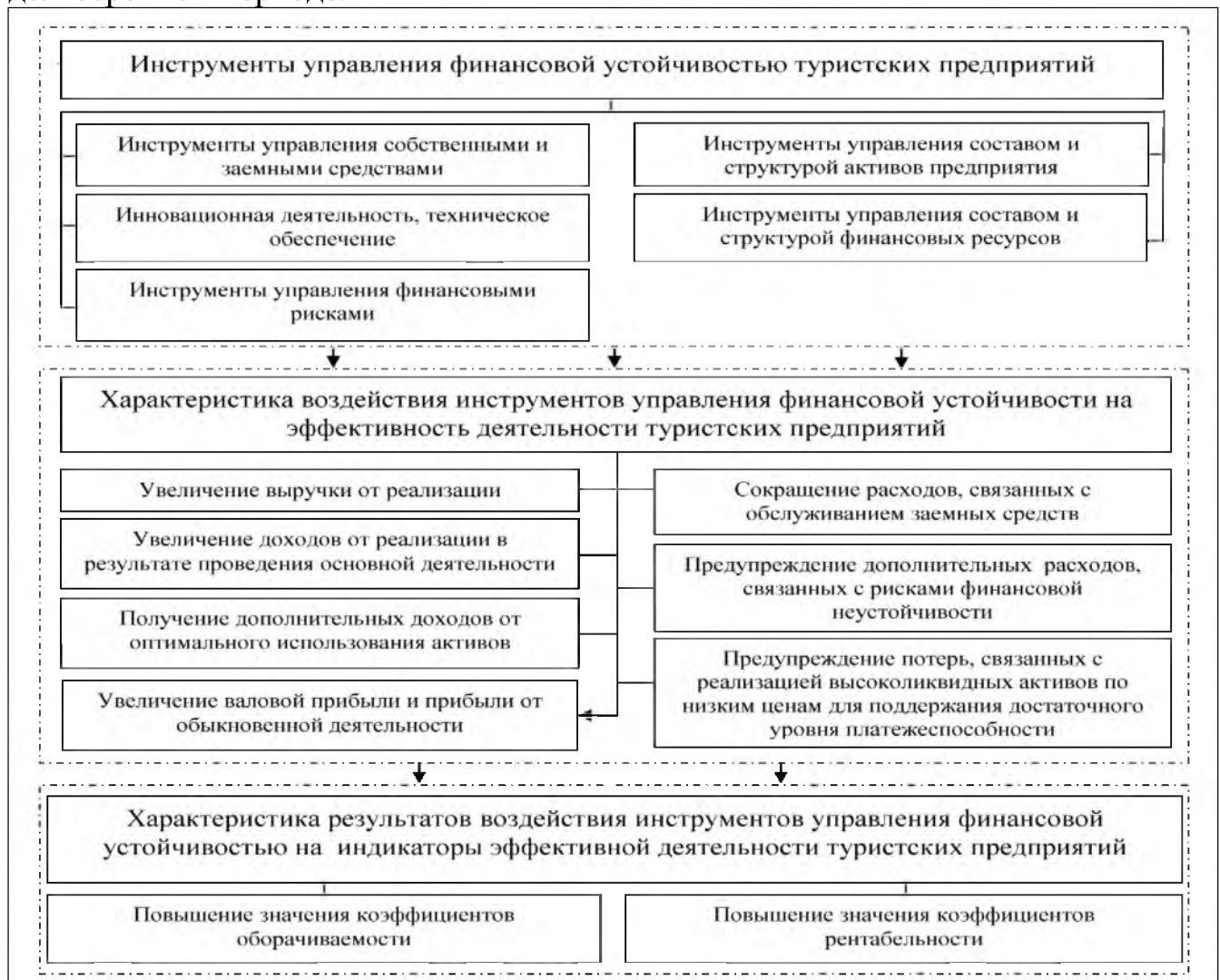
Рис. 2. Инструменты воздействия управления финансовой устойчивостью на индикаторы эффективной деятельности туристских предприятий

маневренность собственного капитала является достаточно низкой. Поэтому, краткосрочная финансовая устойчивость, в условиях действующей стратегии ее управления, может привести к неустойчивому финансовому состоянию в долгосрочном периоде.