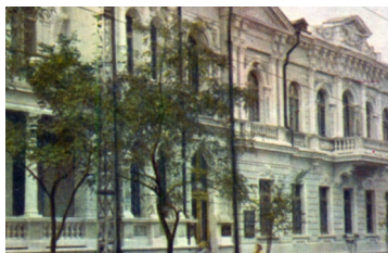
大学教学楼（50年 代中期）