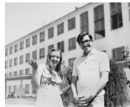
Симферопольский государственный университет в начале 70-х годов Simferopol State University in the beginning of 70s

Среди них - Крымский государственный медицинский университет имени С.И. Георгиевского, Национальная академия природоохранного и курортного строительства, филиал Киевского национального экономического университета имени Вадима Гетьмана, Крымский агротехнологический