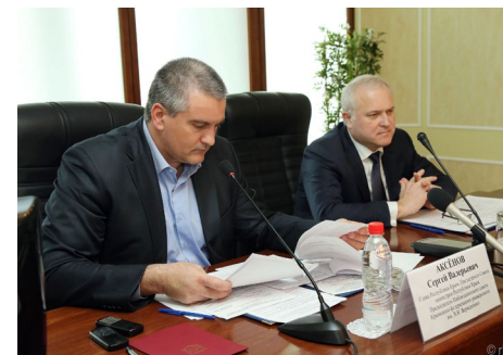
Сергей Аксенов и Сергей Донич на заседании Наблюдательного совета университета Sergey Aksenov and Sergey Donich at the meeting of the Supervisory Council of University

其历史上以弗拉基米尔·伊万诺维奇·维尔纳茨基命名的塔乌里切斯基，这位杰出的俄罗斯科学家与克里米亚有着深深的渊源。