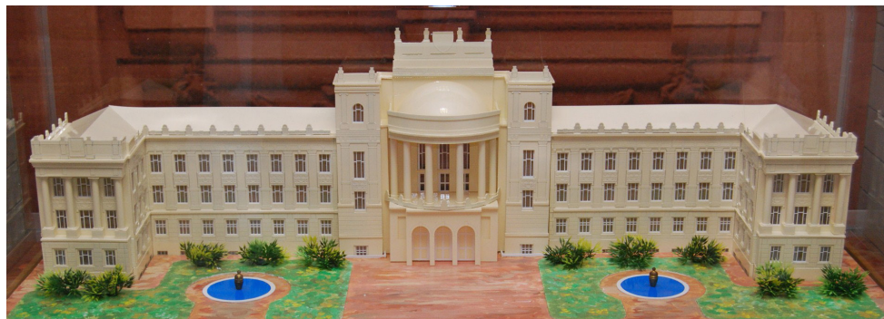
Проект нового корпуса Крымского федерального университета Project of new CFU building

Today V.I.Vernadsky Crimean Federal University has the important purpose – to implement plans for development and expansion of activity of higher education institution. In particular, among the main tasks - modernization of university infrastructure. Now the preparatory work for capital repairs of buildings in structural divisions and branches is carrying out. Since the beginning of 2015 the list of actions for capital repairs of 37 objects of university and construction