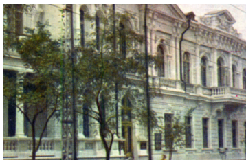
Корпус университета (середина 50-х годов) University building (in the middle of 50s)