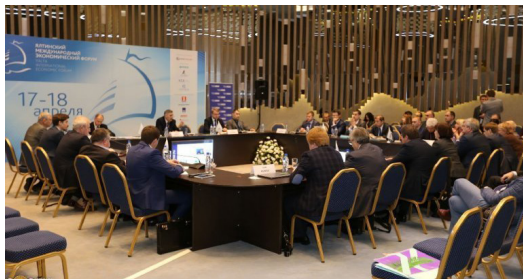
Обсуждение проекта «Цифровой университет» в рамках Ялтинского междуна- родного экономического форума Discussion of the "Digital University" project within the frameworks of Yalta International economic forum

В 2015 году подано 54 заявки на объекты интеллектуальной собственности. Из них 40 – на патенты и 14 – на компьютерные программы, 23 из них поданы вместе со студентами.