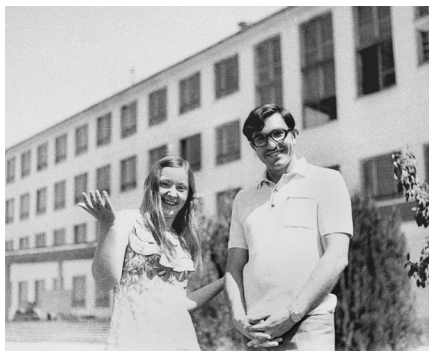
Симферопольский государственный университет в начале 70-х годов Simferopol State University in the beginning of 70s

Среди них - Крымский государственный медицинский университет им. С.И. Георгиевского, Национальная академия природоохранного и курортного строительства, филиал Киевского национального экономического университета имени Вадима Гетьмана, Крымский агротехнологический университет, а также Таврический