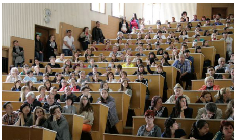
Лекционный зал в Таврической академии Lecture room in Taurida Academy

наук и более 1000 кандидатов наук. По состоянию на 1 сентября 2015 года в Крымском федеральном университете обучается более 36000 студентов, среди которых почти три тысячи из-за рубежа - из Украины, Балтии, Индии, Иордании, Ливана, Палестины, Узбекистана, Грузии, Туркменистана, Алжира и других стран, что обеспечивает КФУ лидирующие позиции в ряду других федеральных университетов России.